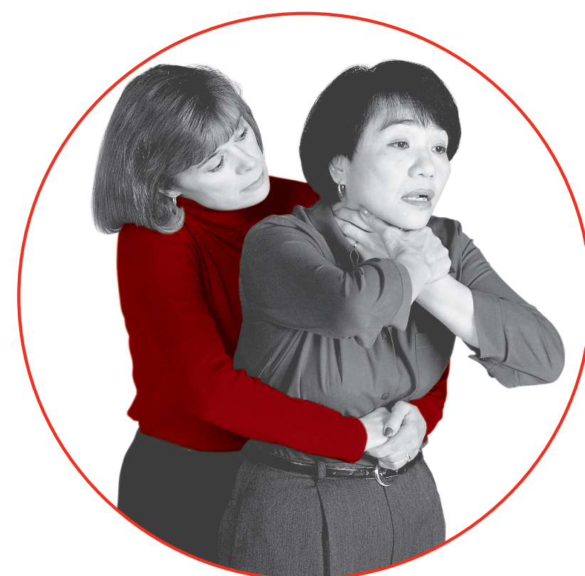
放在肚脐与胸骨下端之间