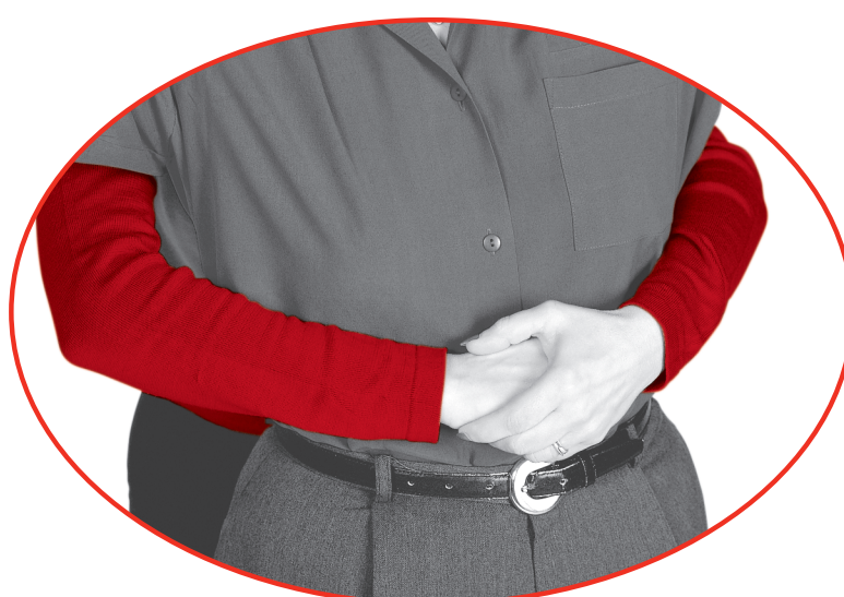
用另一只手握住拳头抵住此人的腹部