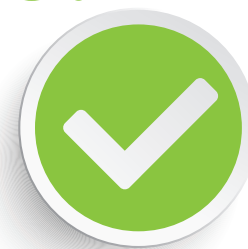
Сон на спине

Если еда попадает в трахею, младенцы задыхаются.