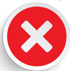
Сон на животе