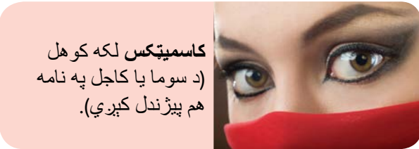
کاسمیټکس لکه کوهل (د سوما یا کاجل په نامه هم پیژندل کېږي).