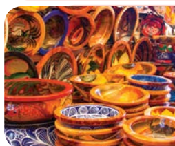
له سیسي سره ګلېز شوي لوبڼي. د خوارو چمتو کولو لپاره یا خورولو لپاره مه کاروئ.