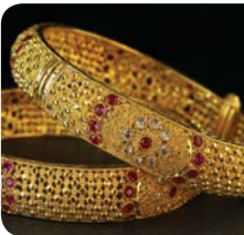
دېوېناک ګاڼې، دزرو یا سپینو زرو پلېټ په شمول.