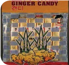
د کنډی څو ډولونه.