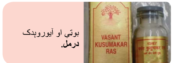
بوټي او آیوروډیک درمل.