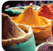
مصالحی، ترمک په شمول.