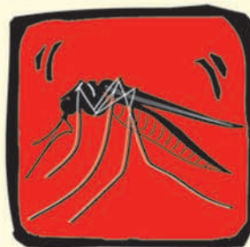
Mosquitos u otros insectos