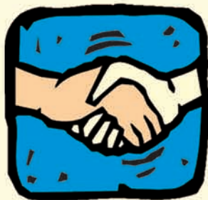
Dar la mano