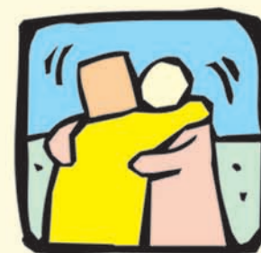
Besar o abrazar